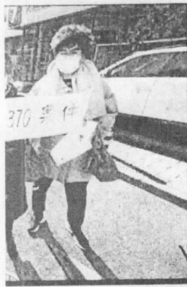
Missing Malaysia Airlines flight MH370 cases' in Monday. — AFP photo

Ten former and current Taiwanese military officers were indicted on Monday for allegedly spying for Beijing, including two who made a video pledging to 'surrender' to the Chinese military, prosecutors said. China claims self-ruled Taiwan as its territory and has ramped up military and political pressures on the island in recent years. The two sides split in 1949 after a civil war and have been spying on each other ever since. Three of the defendants were accused of recruiting active-duty servicemen to collect military information to 'develop a network for China', the Taiwan High Prosecutors' Office said in a statement. — AFP, Taipei