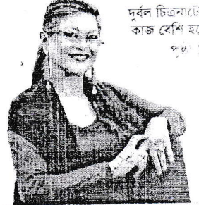
দুর্বল চিত্রনাট্যের কাজ বেশি হচ্ছে পৃষ্ঠা ১৩