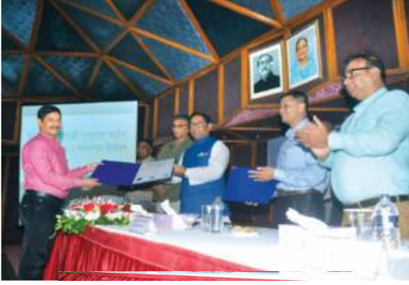
ISO সনদপত্র গ্রহণ করেন ফেনী পবিস এর জেনারেল ম্যানেজার