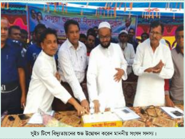
সুইচ টিপে বিদ্যুতায়নের শুভ উদ্বোধন করেন মাননীয় সংসদ সদস্য।

সিরাজগঞ্জ পবিস-২ এর উদ্যোগে বেলকুচি উপজেলার দু'টি গ্রামে