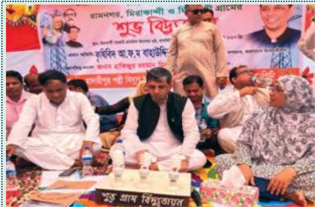
সুইচ টিপে বিদ্যুতায়নের শুভ উদ্বোধন করেন মাননীয় সংসদ সদস্য আ.ফ.ম. বাহাউদ্দিন নাছিম।