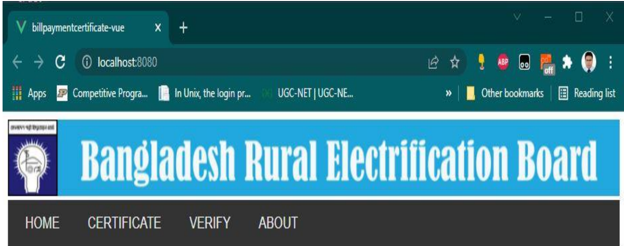
চিত্র- ১.১: হোমপেজ

“ডিজিটাল বিল পেমেন্ট সার্টিফিকেট” ওয়েবসাইটে প্রবেশের জন্য ব্রাউসারের এড্রেস বারে http://billcert.rebpbs.com/ লিখে কি-বোর্ডের “Enter” বাটনে ক্লিক করুন। “Enter” বাটনে ক্লিক করলে গ্রাহক এই ওয়েবসাইটের হোমপেজে প্রবেশ করবেন। হোমপেজে প্রবেশ করলে গ্রাহক “CERTIFICATE” ও “VERIFY” দুটি বাটন দেখতে পাবেন। গ্রাহক তার প্রয়োজন অনুসারে “CERTIFICATE” অথবা “VERIFY” বাটনে ক্লিক করে পরবর্তী পেজে যেতে পারবেন।