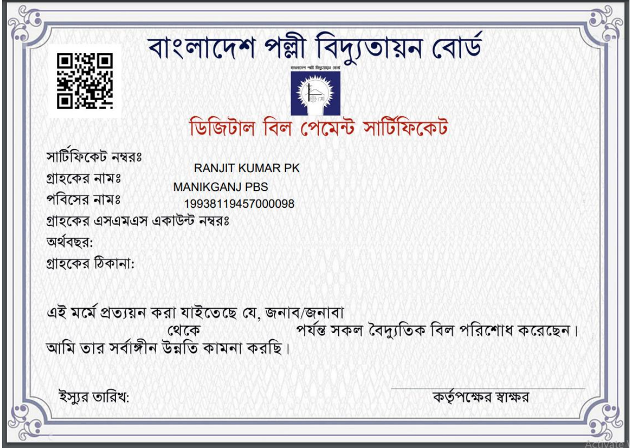
চিত্রঃ ১.৪: সার্টিফিকেট

প্রদত্ত সার্টিফিকেটে একটি সার্টিফিকেট নম্বর এবং একটি কিউআর (QR Code) কোড থাকবে, যা গ্রাহকের সার্টিফিকেট ভেরিফাই করার জন্য ব্যবহৃত হবে।