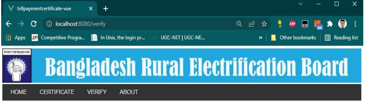
চিত্রঃ ১.৪: ভেরিফিকেশন পেজ

গ্রাহকের সার্টিফিকেটে সংযুক্ত সার্টিফিকেট নম্বর এই ইনপুট বক্সে ইনপুট দিয়ে “Submit” বাটনে ক্লিক করলে যদি গ্রাহক বৈধ সার্টিফিকেট নম্বর দিয়েন থাকেন তবে তিনি “Successfully Verified” মেসেজটি দেখতে পাবেন। গ্রাহক সার্টিফিকেটে সংযুক্ত কিউআর (QR Code) কোড স্ক্যান করলেও “Verify” পেজে এসে সার্টিফিকেট ভেরিফাই করা যাবে।